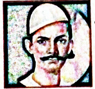
ولادت: 1803ء فیض آباد وفات: 1874ء لکھنؤ

میر انیس: انیس کا پورا نام میر بہر علی انیس تھا۔ وہ 1803ء کو فیض آباد میں پیدا ہوئے اور ڈسمبر 1874ء کو لکھنؤ میں ان کا انتقال ہوا۔ میر انیس بنیادی طور پر مرثیہ گو شاعر ہیں۔ اس کے علاوہ انیس نے مذہب، اخلاقیات اور ذاتیات پر بھی رباعیات کہی ہیں۔ میر انیس کے کلام میں بلا کی روانی سلاست اور فصاحت کے ساتھ جزئیات نگاری کا کمال نظر آتا ہے۔ مرثیہ انیس کی چار جلدیں، دیوان رباعیات انیس وغیرہ ان کی تخلیقات ہیں۔