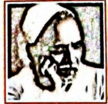
ولادت: 1888ء حیدر آباد وفات: 1961ء حیدر آباد

امجد حیدر آبادی: امجد حیدر آبادی کا پورا نام سید احمد حسین امجد ہے وہ حیدر آباد میں 1888ء کو پیدا ہوئے۔ وہ ایک صوفی مزاج انسان اور پرہیزگار بزرگ تھے۔ امجد رباعی گو شاعر کی حیثیت سے بہت مشہور ہیں۔ اکثر و بیشتر ناصحانہ انداز اختیار کرتے ہیں۔ اخلاقی مضامین، فلسفیانہ نکات دنیا کی بے ثباتی اور زندگی کے اعلیٰ اقدار کو بڑے ہی موثر انداز میں پیش کیا ہے۔ ان کی رباعیوں میں وہی رنگ ہے جو سرمد کی رباعیوں میں پایا جاتا ہے۔ اسی لیے انھیں صوفی سرمد کا خطاب دیا گیا تھا۔ ان کے شعری مجموعہ ریاض امجد، رباعیات امجد، خرقة امجد وغیرہ بہت مشہور ہیں۔ ان کا انتقال 1961ء میں حیدر آباد میں ہوا۔