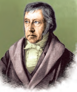
जॉर्ज विल्हेम फ्रेडरिक हेगेल

पद्धतीने मांडले गेले पाहिजे यावर भर दिला. इतिहासातील घटनाक्रम प्रगतीचे टप्पे दर्शवणारा असतो. त्याचबरोबर इतिहासाची मांडणी इतिहासकाराला वेळोवेळी उपलब्ध होत असलेल्या पुराव्यांनुसार बदलत जाणे स्वाभाविक असते, असे प्रतिपादन त्याने केले. त्याच्या विवेचनामुळे इतिहासाच्या अभ्यासपद्धती विज्ञानाच्या पद्धतींपेक्षा वेगळ्या असल्या तरी त्या कमी प्रतीच्या नाहीत, अशी अनेक तत्त्वज्ञांची खात्री पटली. 'एनसायक्लोपिडिया ऑफ फिलॉसॉफिकल सायन्सेस' या ग्रंथामध्ये त्याची व्याख्याने आणि लेख यांचे संकलन आहे. हेगेलने लिहिलेले 'रिझन इन हिस्ट्री' हे पुस्तक प्रसिद्ध आहे.