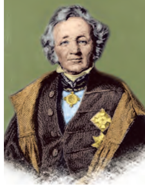
लिओपॉल्ड व्हॉन रॉंके

लिओपॉल्ड व्हॉन रॉंके याच्या विचारांचा प्रभाव होता. त्याने इतिहास संशोधनाची चिकित्सक पद्धती कशी असावी ते सांगितले. मूळ दस्तऐवजांच्या आधारे प्राप्त झालेली माहिती ही सर्वाधिक महत्त्वाची आहे, यावर त्याने भर दिला. तसेच ऐतिहासिक घटनांशी संबंधित असलेल्या सर्व प्रकारची कागदपत्रे