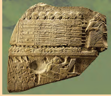
फ्रान्स येथील लुव्र या संग्रहालयातील सर्वाधिक प्राचीन शिलालेख

वरील चित्रात हातात ढाल आणि भाला घेतलेल्या सैनिकांची शिस्तबद्ध रांग आणि त्यांचे नेतृत्व करणारे सेनानी दिसत आहेत.