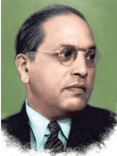
डॉ. बाबासाहेब आंबेडकर

भारताच्या सांस्कृतिक आणि राजकीय घडणीत दलित वर्गाचा मोठा वाटा आहे. भारताच्या वसाहतवादी आणि राष्ट्रवादी इतिहासलेखनात त्याकडे