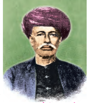
महात्मा जोतीराव फुले

महात्मा फुले यांनी 'गुलामगिरी' या पुस्तकात शूद्रातिशूद्रांचा इतिहास नव्याने उलगडून दाखवला. धर्माच्या नावाखाली स्त्रिया, शूद्र व अतिशूद्र यांच्या होणाऱ्या शोषणाकडे लक्ष वेधले.