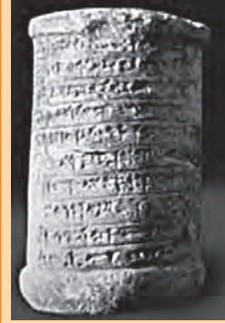
पुरावस्तूचे वर्णन करणारी मातीची वटिका

जगातील सर्वांत प्राचीन समजले जाणारे (इ.स.पू. ६ वे शतक) संग्रहालय मेसोपोटेमियातील 'उर' या प्राचीन शहराचे उत्खनन करताना सापडले. हे उत्खनन ब्रिटिश पुरातत्त्वज्ञ सर लिओनार्ड वुली यांनी १९२२ ते १९३४ या काळात केले होते. हे संग्रहालय एनिगॉल्डी नावाच्या मेसोपोटेमियाच्या राजकन्येने बांधले होते. ती स्वतः त्या संग्रहालयाची संग्रहपाल म्हणून काम पाहत असे.