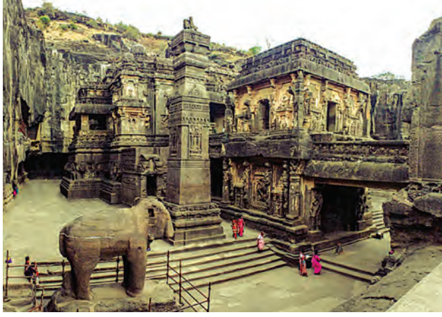
कैलास मंदिर, वेरूळ

युनेस्कोच्या जागतिक नैसर्गिक वारशाच्या यादीत पश्चिम घाटाचा समावेश २०१२ मध्ये केला गेला आहे. सातारा जिल्ह्यातील कास पठार पश्चिम