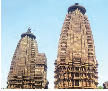
नागर शैलीचे शिखर

मंदिर स्थापत्य पूर्ण विकसित झाले होते, हे वेरूळ येथील कैलास मंदिराच्या भव्य रचनेवरून सहज लक्षात येते. मध्ययुगीन