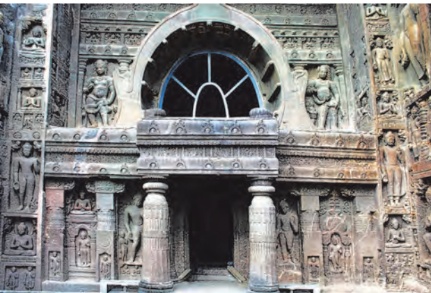
अजिंठा लेणे क्र. १९ प्रवेशद्वार

स्थापत्य आणि शिल्पकला : भारतामध्ये अनेक कोरीव लेणी आहेत. कोरीव लेण्यांची परंपरा भारतामध्ये इसवी सनापूर्वी तिसऱ्या शतकात सुरू झाली. तांत्रिकदृष्ट्या संपूर्ण लेणे हे स्थापत्य आणि कोरीव शिल्पाचे एकत्रित उदाहरण असते. प्रवेशद्वारे, आतील खांब आणि मूर्ती हे शिल्पकलेचे उत्तम नमुने असतात. भिंती आणि छत यांवर केलेले उत्तम चित्रकाम काही लेण्यांमध्ये अजूनही काही प्रमाणात टिकून आहे. महाराष्ट्रातील अजिंठा आणि वेरूळ