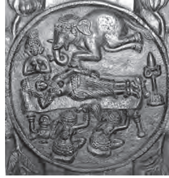
भारतूत स्तूप : शिल्प

संस्कृतीमधील मुद्रा, दगडी आणि कांस्य पुतळे पाच हजार वर्षे किंवा त्यापेक्षा अधिक प्राचीन असलेल्या भारतीय शिल्पकलेच्या परंपरेची साक्ष देतात. मौर्य सम्राट अशोकाच्या काळातील दगडी स्तंभांपासून भारतातील कोरीव दगडी शिल्पनिर्मितीला खऱ्या