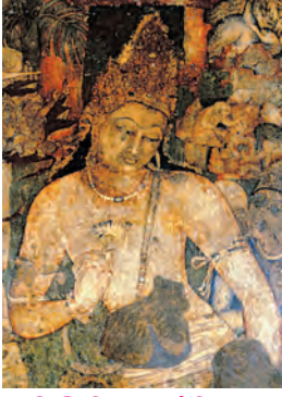
भित्तिचित्र : बोधिसत्त्व पद्मपाणि

दृक्कलांमध्ये चित्रकला आणि शिल्पकला यांचा समावेश होतो.