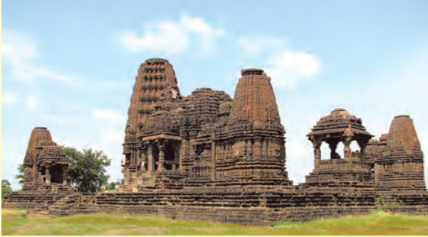
गोंदेश्वर मंदिर - सिन्नर

महाराष्ट्रातील बाराव्या-तेराव्या शतकातील मंदिरांना 'हेमाडपंती' मंदिरे असे म्हणतात. हेमाडपंती मंदिराच्या बाह्य भिंती बऱ्याचदा तारकाकृती असतात. तारकाकृती मंदिराच्या बांधणीत मंदिराची बाह्य भिंत अनेक कोनांमध्ये विभागली जाते. त्यामुळे त्या भिंती आणि त्यावरील शिल्पे यांच्यावर छायाप्रकाशाचा सुंदर परिणाम पाहण्यास मिळतो. हेमाडपंती मंदिरांचे महत्त्वाचे वैशिष्ट्य म्हणजे भिंतीचे दगड सांधण्यासाठी चुना वापरलेला नसतो. दगडांमध्येच एकमेकांत घट्ट बसतील अशा कातलेल्या खोबणी आणि कुसू यांच्या आधाराने भिंत उभारली जाते. मुंबईजवळील अंबरनाथ येथील अंब्रेश्वर, नाशिकजवळचे सिन्नर येथील गोंदेश्वर, हिंगोली जिल्ह्यातील औंढा नागनाथ ही हेमाडपंती मंदिराची उत्तम उदाहरणे आहेत. त्यांची बांधणी तारकाकृती प्रकारची आहे. त्याखेरीज महाराष्ट्रात अनेक ठिकाणी हेमाडपंती मंदिरे पहावयास मिळतात.