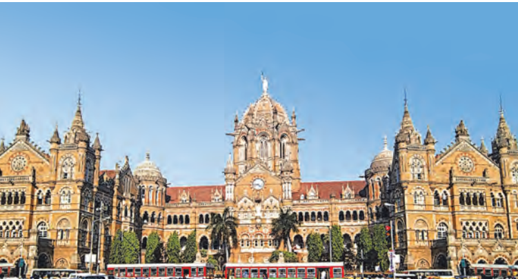
छत्रपती शिवाजी महाराज रेल्वे टर्मिनस

भारतात ब्रिटिश सत्ता प्रस्थापित झाल्यानंतर एक नवीन स्थापत्यशैली उदयाला आली. तिला इंडो-गोथिक स्थापत्यशैली असे म्हटले जाते. ब्रिटिश काळात बांधल्या गेलेल्या चर्च, सरकारी कचेऱ्या, मोठ्या पदाधिकाऱ्यांची निवासस्थाने, रेल्वे स्टेशन यांसारख्या इमारतींमध्ये ही शैली पहावयास मिळते.