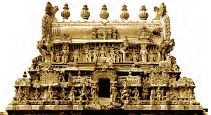
द्राविड शैलीचे गोपूर

काळापर्यंत भारतीय मंदिर स्थापत्याच्या अनेक शैली विकसित झाल्या. शिखरांच्या रचना वैशिष्ट्यांनुसार या शैली ठरतात. त्यामध्ये उत्तर भारतातील 'नागर' आणि दक्षिण भारतातील 'द्राविड' या दोन शैली प्रमुख मानल्या जातात. या दोहोंमधून विकसित झालेल्या मिश्र शैलीला 'वेसर' असे म्हटले जाते. मध्य प्रदेश आणि महाराष्ट्रात आढळणारी 'भूमिज' मंदिरशैली आणि 'नागर' मंदिरशैली यांच्यामध्ये रचनेच्या दृष्टीने साम्य आढळते. भूमिज शैलीत क्रमशः लहान होत जाणाऱ्या शिखरांच्या प्रतिकृती वरपर्यंत रचलेल्या असतात.