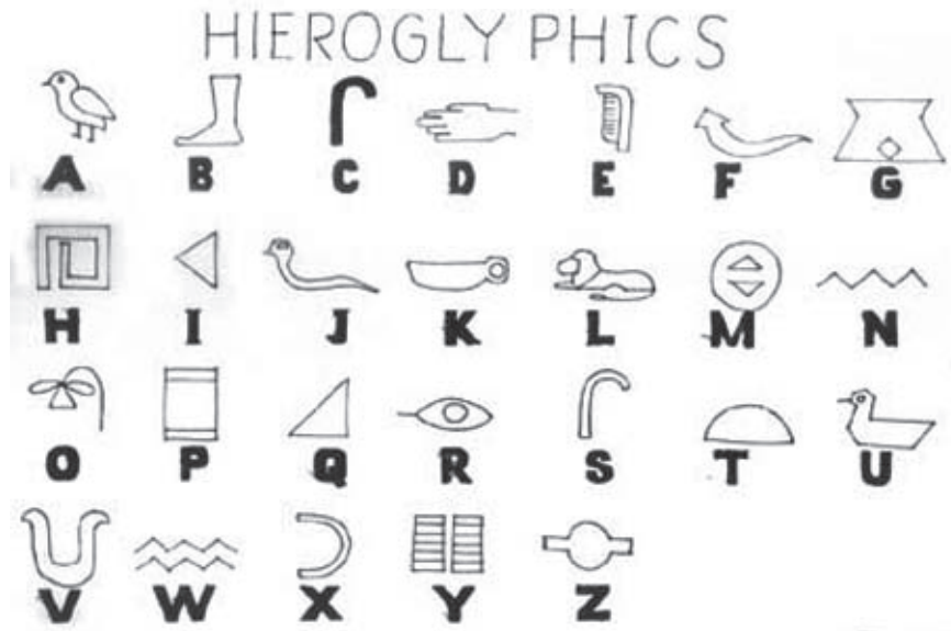
चित्र 1.2 हिरोग्लिफिक्स लिपि

फराओं ने प्राचीन विश्व के महान स्मारक पिरामिड बनवाए। मिस्रवासी मौत के बाद जिंदगी पर यकीन करते थे और इसलिए उन्होंने शवों को संरक्षित रखा। इन संरक्षित शवों को ममी कहा जाता है। पिरामिड को मृत राजाओं के ममी किए गए शवों को रखने के लिए मकबरों के रूप में बनाया गया था।