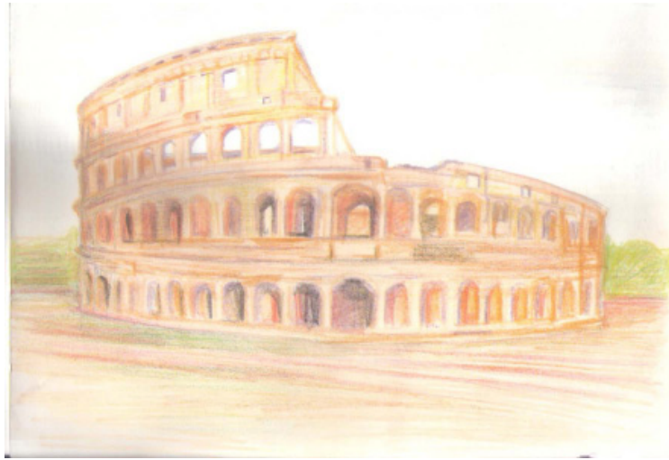
चित्र 1.3 : रोमन साम्राज्य के अवशेष

रोम एक गणराज्य था। इसके बावजूद ताकतवर और प्रभावशाली नेता सत्ता के लिए लड़े जुलियस सीजर ऐसा ही एक नेता था, जिसने जबर्दस्त शक्ति जमाकर ली थी और तानाशाह बन बैठा था। विरोधियों ने सीजर की हत्या कर दी और रोम में गृह युद्ध छिड़ गया। युद्ध के बाद आगस्टस सीजर रोम का पहला सम्राट बना। रोमन साम्राज्य तीन महाद्वीपों - यूरोप, एशिया और अफ्रीका में फैला था। आगस्टस के शासन काल में महान पैगंबर ईसा मसीह का जन्म बेथलेहेम में हुआ। उन्होंने एक नए धर्म का प्रचार शुरू किया। उनके अनुसार सभी नर-नारी ईश्वर की संतान हैं। उन्होंने लोगों को एक दूसरे से मुहब्बत करना सिखाया। उनके निधन के बाद ईसा के अनुयाइयों ने उनकी शिक्षाओं को आम लोगों के बीच फैलाना शुरू किया।