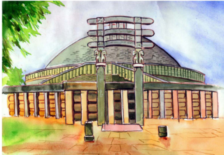
चित्र 1.5 : सांची का स्तूप

प्राचीन भारतीयों ने कला, वास्तुकला, चित्रकला और मूर्तिकला में जबरदस्त महारत दिखाई। अशोक के लाट, अजंता और एलोरा की गुफाएँ, दक्षिण भारतीय मंदिर वास्तुकला, सांची के स्तूप, मथुरा के बुद्ध के भारतीय कला के अथाह समुद्र के महल कुछ उदाहरण हैं। प्राचीन भारत में नालंदा, तक्षशिला, क्रमशिला, बलभी, काशी और कांची जैसे ज्ञान के केन्द्र थे, जहाँ भारतीय और विदेशी छात्रों को शिक्षा जाती थी। प्रसिद्ध विद्वान और शिक्षक वहाँ पढ़ाते थे। भारतीय ज्ञान और विद्वता की बाहर काफी सराहना की गई, खासकर अरब मुसलमानों द्वारा।