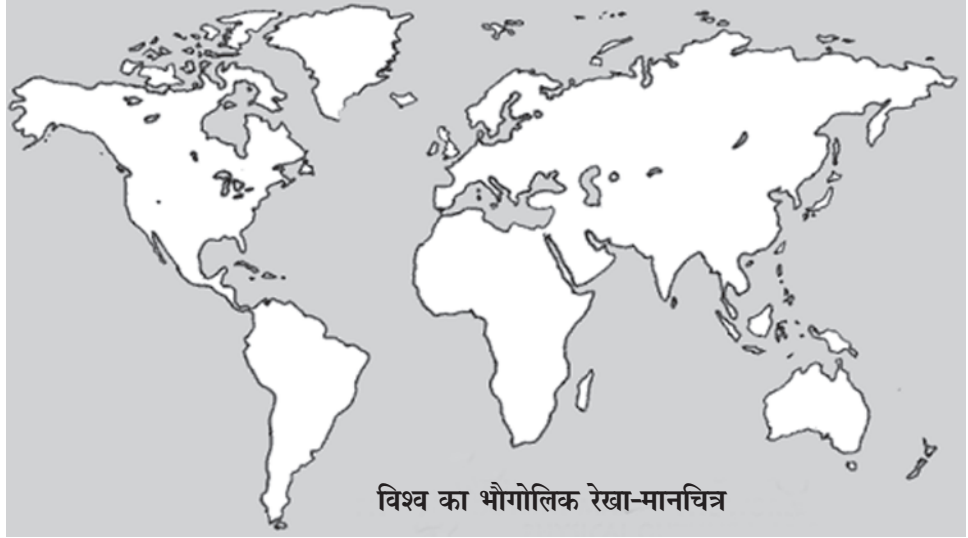
विश्व का भौगोलिक रेखा-मानचित्र