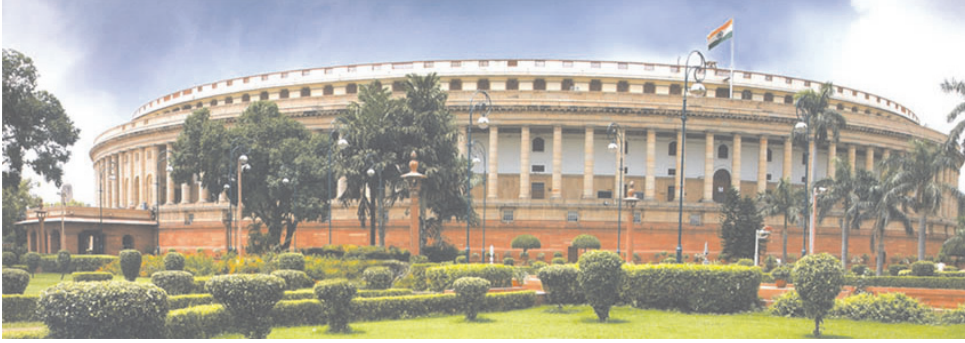
चित्र 20.5 भारत का संसद् भवन