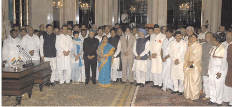
चित्र 20.4 संघीय मन्त्रीपरिषद् के सदस्य शपथ ग्रहण के बाद (2009)