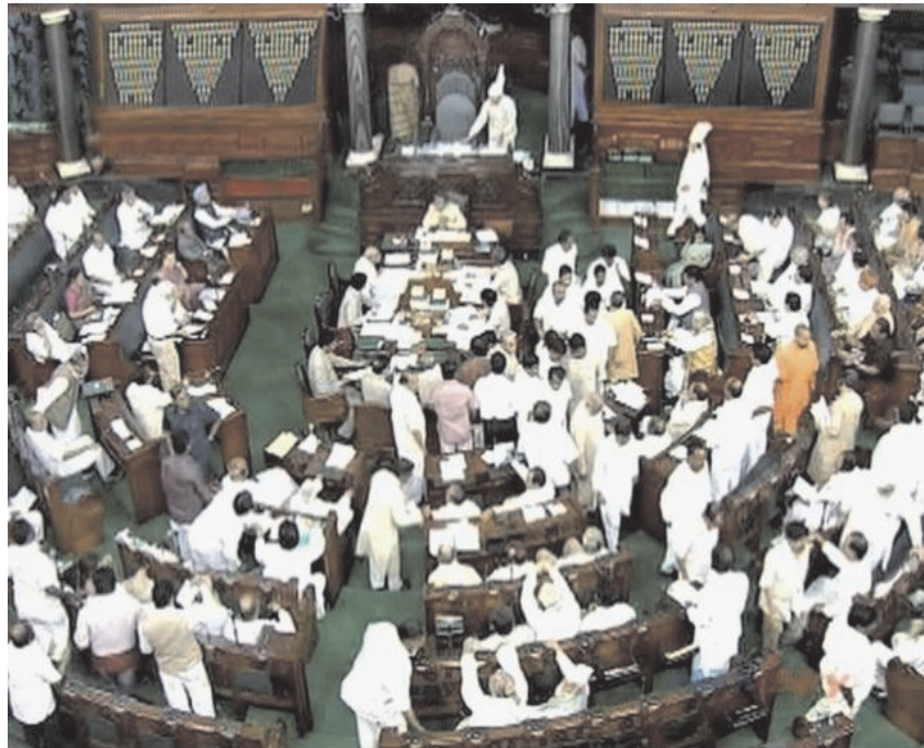
चित्र 20.6 लोक सभा अधिवेशन

लोक सभा का अध्यक्ष स्पीकर कहलाता है और वह लोक सभा की अध्यक्षता करता है तथा उसकी अनुपस्थिति में उपाध्यक्ष अध्यक्षता करता है। लोकसभा सदस्य अपने सदस्यों के बीच से ही अध्यक्ष तथा उपाध्यक्ष का निर्वाचन करते हैं; वह निचले सदन में अनुशासन और व्यवस्था बनाए रखता है तथा कार्यवाही का निरीक्षण करता है। वह यह निर्णय करता है कि कौन-सा सदस्य कितने समय के लिए बोलेगा। आमतौर पर वह मतदान में भाग नहीं लेता परन्तु निर्णय न होने की स्थिति में अपना मत डाल सकता है। अध्यक्ष ही निर्णय करता है कि कौन-सा विधेयक साधारण अथवा धन विधेयक है और उसका निर्णय अन्तिम होता है। वह सदस्यों के अधिकारों तथा सुविधाओं का संरक्षक होता है। लोक सभा और राज्य सभा की संयुक्त बैठक के मामले में लोक सभा का अध्यक्ष ही बैठक की अध्यक्षता करता है।