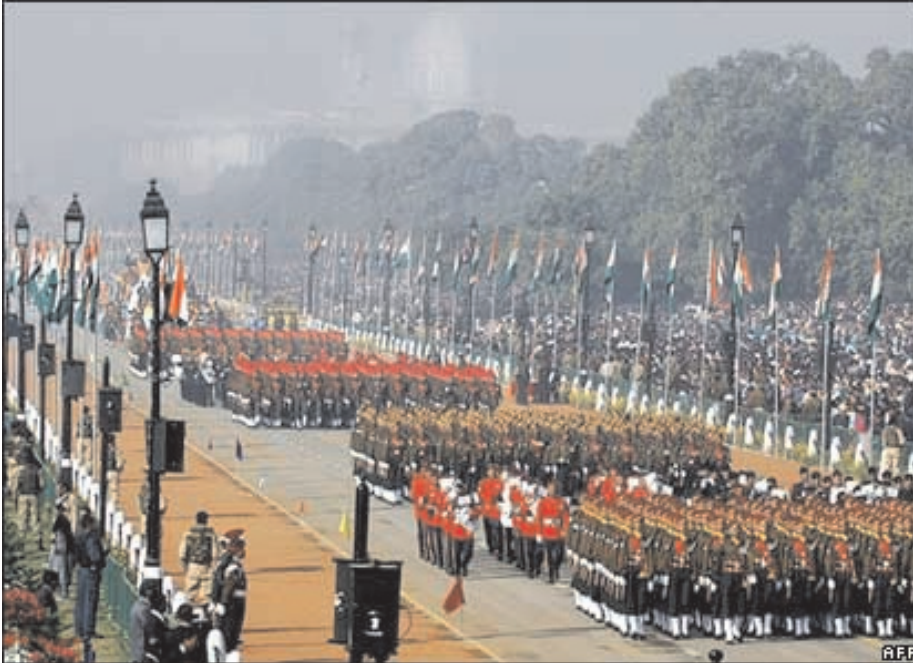
चित्र 20.1 गणतन्त्र दिवस परेड

निम्नलिखित चित्र गणतन्त्र दिवस परेड का है। हम प्रतिवर्ष 26 जनवरी को गणतन्त्र दिवस मनाते हैं। भारत को एक गणतन्त्र के रूप में जाना जाता है। क्या आप इसका कारण जानते हैं? इसका कारण है कि भारत का राष्ट्रपति निर्वाचित होता है। ब्रिटेन में ऐसा नहीं है अपितु वहाँ का राज्य प्रमुख राजा अथवा महारानी होती है। वहाँ यह पद वंशानुगत है।