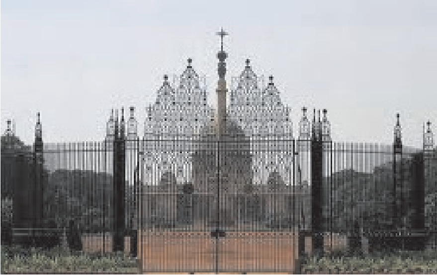
चित्र 20.3 राष्ट्रपति भवन

अनुसार राष्ट्रपति को 10,000 रुपये मासिक वेतन मिलता था जिसे 1998 में बढ़ा कर 50 हजार रुपये कर दिया गया था तथा फिर से 2008 में बढ़ाकर एक लाख पचास हजार रुपये कर दिया गया। इसके अतिरिक्त अन्य कई भत्ते तथा सुविधाएँ भी मिलती हैं और वह नई दिल्ली में स्थित राष्ट्रपति भवन में निवास करता है।