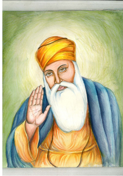
चित्र 2.2 : गुरु नानकदेव

से अलग-थलग रह। उन्होंने बेहद सादी जिंदगी बिताई और आमजन के दुखों और चिंताओं में भागीदारी निभाई। नतीजतन आम लोगों, हिन्दू-मुसलमान दोनों पर उनका जबर्दस्त प्रभाव था। सूफी और भक्ति आंदोलन के बीच बहुत संपर्क रहा। दोनों ने दार्शनिक विचारों का खूब आदान-प्रदान किया। वास्तव में दोनों परंपराओं ने हिन्दुओं और मुसलमानों के बीच सेतु का काम किया।