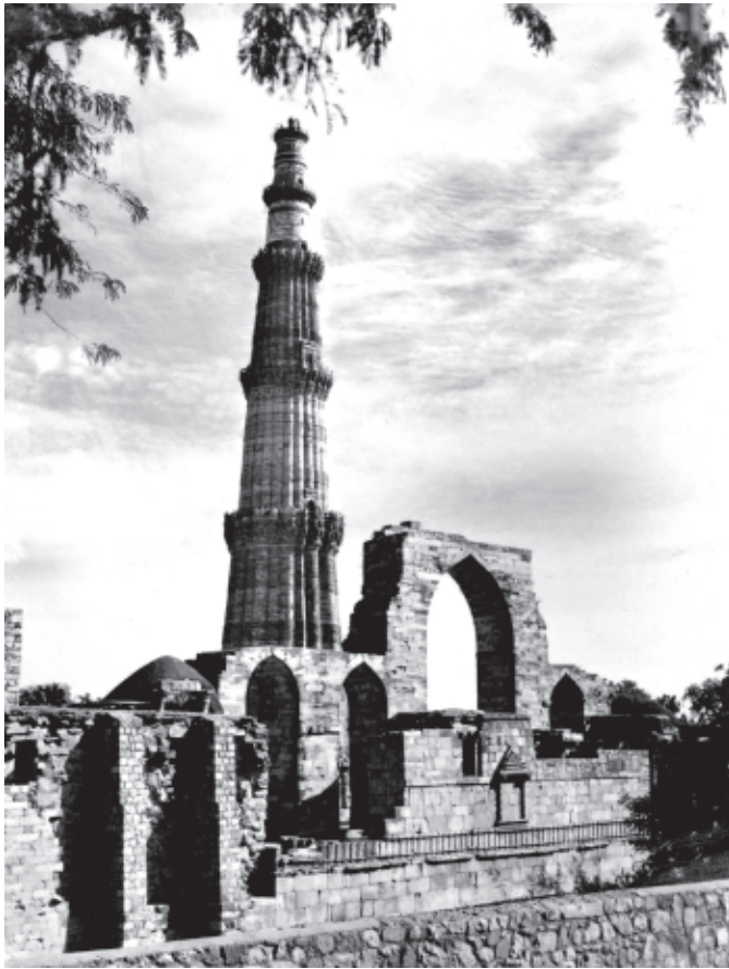
चित्र 2.3 कुतुबमीनार

मध्यकालीन भारत में सांस्कृतिक जीवन का एक अन्य मजेदार पहलू हिन्द-इस्लामी वास्तुकला में उजागर होता है। इसमें भारतीय संसाधनों, विशेषज्ञता, प्रतीकों, डिजाइनों को इस्लामी, मुख्यतः ईरानी शैली में आत्मसात किया गया। महराब और गुम्बद जैसी विशेषताओं को घण्टों, स्वास्तिक, कमल और कलश जैसे हिन्दू प्रतीकों के साथ जोड़ा गया। कुतुब मीनार, अलाई दरवाजा और गियासुद्दीन तुगलक के मकबरे जैसे तुगलककालीन विभिन्न स्मारक दिल्ली सल्तनत के काल की वास्तुकला के शानदार उदाहरण हैं। मुगल काल के स्मारकों में हिन्द-इस्लामी शैली के आत्मसात करने की प्रक्रिया ज्यादा गहरी है। पांच महल, बीरबल का महल और इबादतखाना जैसे फतेहपुर सीकरी के स्मारक, दिल्ली में हुमायूँका मकबरा, सिकन्दरा में अकबर का मकबरा, आगरा का इत्मातुद्दौला का मकबरा और बेशक ताजमहल मुगल वास्तुकला की शानदार मिसालें हैं।