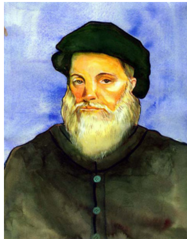
चित्र 3.3 : वास्को दा गामा

तुम्हें क्यों लगता है कि महान रोमांची यात्रा राजा और अमीर लोगों द्वारा प्रायोजित की गई थी? व्यापार और औपनिवेशीकरण में जबरदस्त वृद्धि से यूरोपीय धन वृद्धि पर एक महान प्रभाव पड़ा। एक सबसे प्रसिद्ध राजा जो यात्रा को प्रायोजित करता था पुर्तगाली था। वह था राजा हेनरी जो हेनरी नेविगटर के रूप में भी जाना जाता है। इन खोजों के लिए तकनीकी आधार कम्पास, वेधयंत्रकी, खगोलीय सारणी और नक्शे बनाने के कला के आविष्कार से हुआ। इन यात्राओं से विश्व के विभिन्न भागों में जैसे- अफ्रीका, अमेरिका और एशिया में व्यापारिक चौकी बनाने और औपनिवेशिक साम्राज्य की स्थापना के लिए मार्ग प्रशस्त हुआ। अब वाणिज्यिक रुचि अटलांटिक महासागर से भूमध्य सागर से स्थानांतरित हो गई। कई नई वस्तुएं जैसे तम्बाकू, गुड़, शतुरमुर्ग पंख, आलू, आदि व्यापार में शामिल की गई। इसने अमानवीय दास व्यापार की शुरुआत की। गुलाम अफ्रीका से पकड़ कर अटलांटिक महासागर के पार और उत्तरी अमेरिका में वृक्षारोपण में काम करने के लिए बेचे जाते थे। इन व्यापार पद्धतियों और नई समुद्री मार्गों