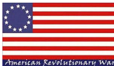
चित्र 3.5 अमेरिकी स्वतंत्रता संग्राम का ध्वज