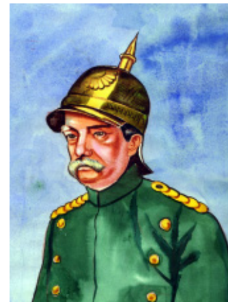
चित्र 3.4 : ओटो वोन बिस्मार्क

1815 में नेपोलियन की हार के बाद, कई जर्मन एक स्वतंत्र जर्मनी चाहते थे। जर्मनी 39 छोटे राज्यों का संघ था और ऑस्ट्रिया और प्रशिया के नेतृत्व में था। ये राज्य हमेशा एक दूसरे के साथ युद्ध की स्थिति में थे, प्रशिया को राजा, कैसर विलियम प्रथम प्रधानमंत्री विस्मार्क को प्रशिया के शासन के अधीन जर्मनी को एकजुट, करना चाहता था और ऑस्ट्रिया और फ्रांस को पूरी तरह से बाहर रखना चाहता था बिस्मार्क निडर था और उसे जर्मनी के एकीकरण की तत्काल आवश्यकता में विश्वास था यह उसने सेना के आधुनिकीकरण के साथ शुरू किया, उसने खून और आयरन की नीति के लिए जाना जाने लगा और उसने लौह चासंलर की उपनाम अर्जित किया।