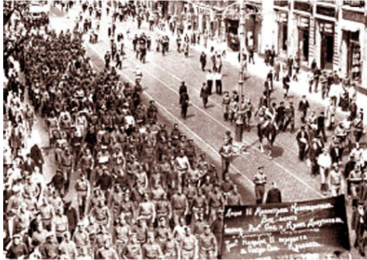
चित्र 3.7 : 18 जून 1917 पैट्रोग्राद में लोगों द्वारा प्रदर्शन

1917 में, रूस में एक और क्रांति हुई। ऐसा इसलिए हुआ क्योंकि वह रूसी मजदूरों और किसानों और रूस में रहने वाले गैर रूसी लोगों की हालत जार निकोलस द्वितीय के निरंकुश शासन के अधीन बुरी थी। वे काफी दुखी थे। अमानवीय काम की परिस्थितियों और करों की विशाल राशि के साथ साथ उनका शोषण किया जा रहा था इसलिए लोग उसके खिलाफ उठे। लोगों को किसी राजनीतिक अधिकारों की मनाही थी। और रूस ने अपनी साम्राज्यवादी इच्छाओं के लिए प्रथम विश्व युद्ध में भी प्रवेश कर लिया था। लेकिन ऐसा करना अनुचित था रूसी सैनिकों हजारों की संख्या में प्रथम विश्व युद्ध में मारे गए थे। वे बीमार थे और बिना गर्म वर्दी या हथियारों से लैस थे साइबेरिया की ठंडे रेगिस्तान में लड़ने के लिए। कई कुशल श्रमिकों को सेना में भर्ती किया गया। और उनको मौत के लिए युद्ध में लड़ने के लिए मजबूर किया गया। कुलीन वर्ग भी जार निकोलस द्वितीय के निरंकुश तरीके के कारण असंतुष्ट थे। अकाल से देश में स्थिति बिगड़ गई। श्रमिकों ने अदालतों, जेलों और कार्यालय परिसर पर हमला किया। समाज के सभी वर्गों के बीच व्यापक असंतोष था। सेना में गोला बारूद का अभाव था। शहरों में भोजन का अभाव था जबकि किसानों को अपनी उपज के उचित दाम नहीं मिल रहे थे। इस सरकार ने मुद्रास्फीति के कारक रूबल नोटों को लाखों में छापा। स्थिति जार के हाथ से फिसल गई।