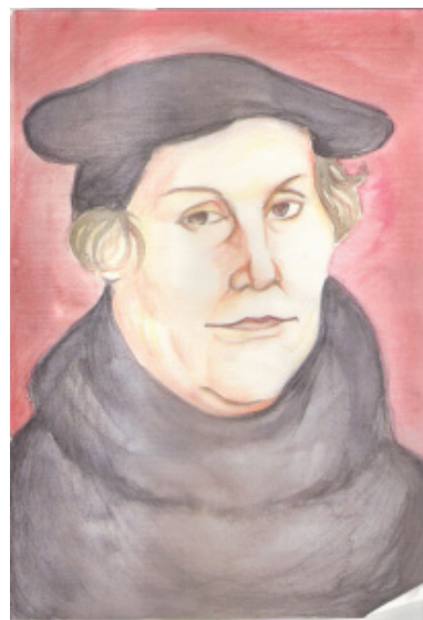
चित्र 3.2 मार्टिन लूथर

लूथर के विचारों ने पश्चिम में प्रोटेस्टेंट धर्म सुधार की शुरुआत की और ईसाई जगत को दो भागों में बांट दिया, प्रोटेस्टेंट और रोमन कैथोलिक। उसके अनुसार ईसाईयों को मुक्ति ईसा मसीह के बताए रास्ते पर चलने से मिलती न कि पोप स्वीकारोक्ति पत्र खरीदने से। हालांकि इंग्लैंड में धर्म सुधार आंदोलन लूथर के विचारों से प्रभावित था परन्तु यह वहां के राजा हेनरी आठवें