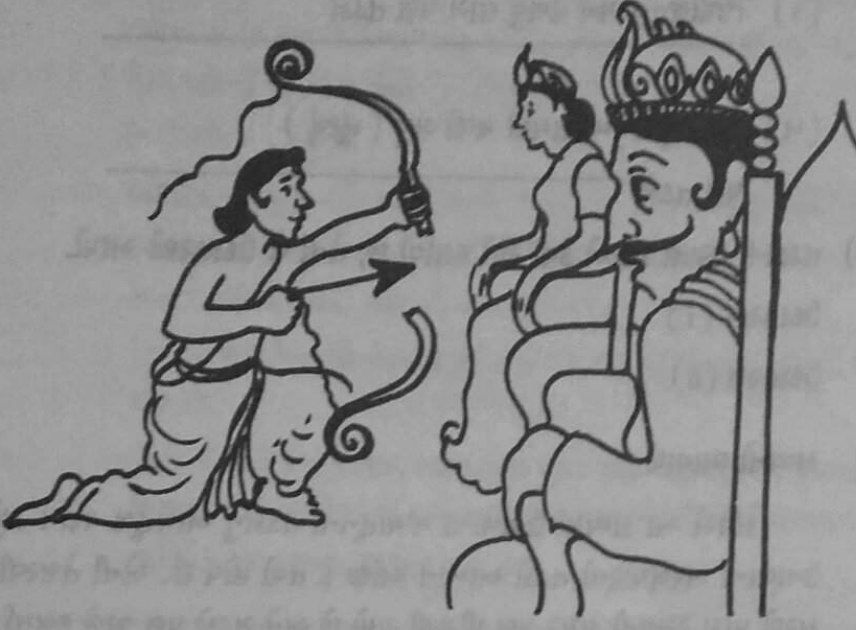
વૈદેહીનું ધનુષ્ય રામથી ડગ્યું